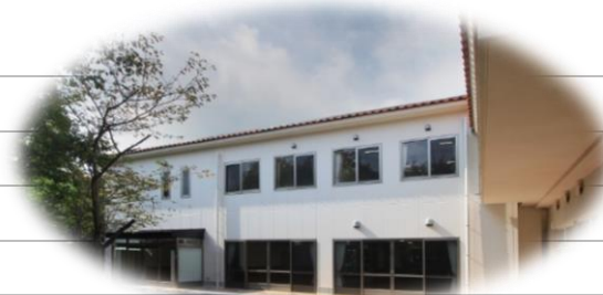
災害避難スペース(3号館)の外観です。