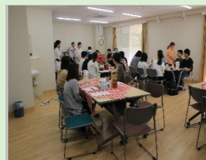
職員との交流会あり