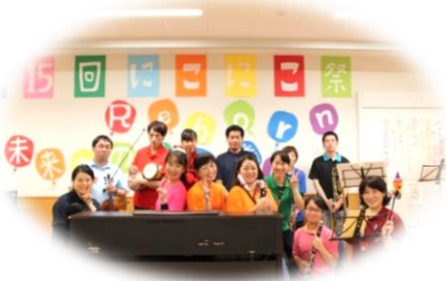
クラブ活動 音楽隊