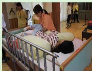
多様な体験ができる!