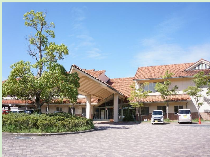
施設(本館)から2/3号館をくまなく見学