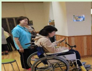
今年は何が体験できるかなあ?

お問合せ 社会福祉法人芳友 にこにこハウス医療福祉センター 〒651-1106 神戸市北区しあわせの村1-9