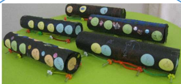
金クラス そらとぶ電車