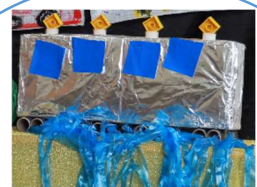
火クラス 水上電車