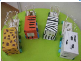
月クラス どうぶつ電車