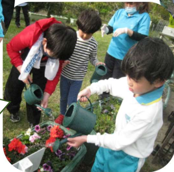
いろいろなお花の寄せ植えをしたよ