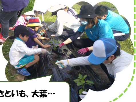
ピーマン、さといも、大葉… 収穫が待ち遠しいね♪